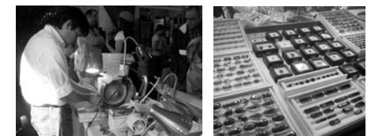
Polishing semi-precious stones