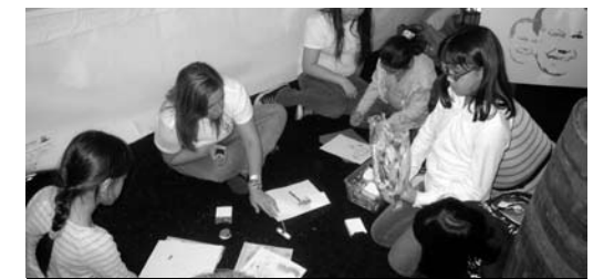
Children drawing after presentation of Fernando Sabino's film